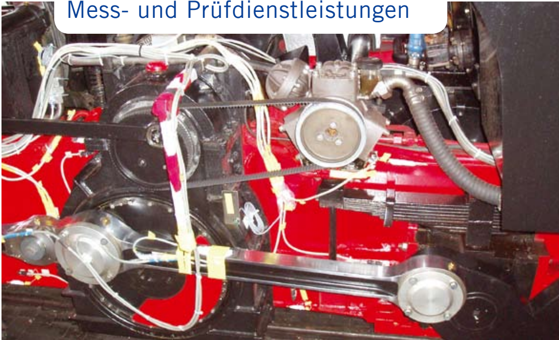
Messung der Betriebsfestigkeit an einer modernen Dampflokomotive der Schafbergbahn in Österreich