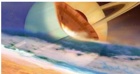
Huygens-Lander beim Eintauchen in die Titan-Atmosphäre

Für die Firma CONTRAVES Space wurden zur Sicherstellung von Festigkeit bei minimalem Gewicht und Kosten Konstruktionsoptimierungen für das Hitzeschild des Huygens Landemoduls durchgeführt.