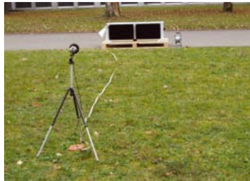
Schallpegelmesser vor einem AL D886 A01 Umrichter

Diese Umrichter werden in Fahrzeugen eingebaut, die strenge Normen bezüglich Lärmemission einhalten müssen. Somit ist es wichtig, dass schon frühzeitig erkannt wird, welche Bauteile (u.a. die untersuchten Hilfsbetriebeumrichter) welchen Anteil am Gesamtschall haben werden.