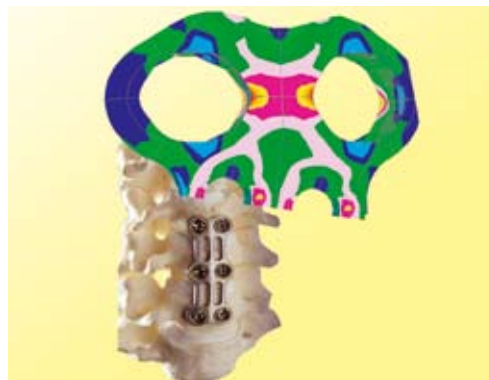
Verteilung der mechanischen Spannungen im FE-Modell und ein Wirbelsäulenmodell mit Implantat

derungen reduziert werden konnten. Dadurch verlängert sich die Lebensdauer der Implantate und es werden weniger operative Eingriffe am Patienten notwendig. Dies steigert letztlich die Wettbewerbsfähigkeit der Produkte.