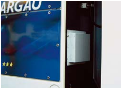
Schalldämpfer in eingebautem Zustand

Die Analysen der Messergebnisse und der möglichen Schallpfade wurden als Grundlage für die akustische Auslegung eines Schalldämpfers verwendet. Unter Berücksichtigung der Vorgaben, der Einsatzbedingungen und des extrem begrenzten Einbauraumes wurde ein Schalldämpfer entwickelt, konstruiert und erprobt.