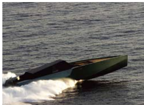
WALLYPOWER 118 in voller Fahrt auf offenem Meer während Messungen im Antriebsstrang

Die Hochleistungsyacht WALLYPOWER 118 besitzt Lamellenkupplungsgetriebe der Firma Maag Gear AG. Für eine Produktabsicherungsmessung wurden unter realen Bedingungen an einer voll funktionsfähigen Yacht Messungen im Antriebsstrang durchgeführt. Das Verhalten bei den Kuppelvorgängen wurde untersucht, indem Drehzahl- und Druckmessungen am Koppelgetriebe bei voller Fahrt vorgenommen wurden.