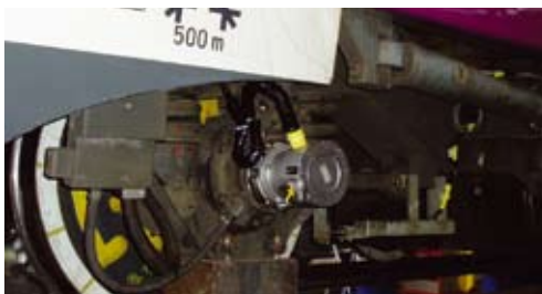
Sala montata atta alla misurazione dell'interazione ruota - rotaia durante le prove sulla dinamica di marcia

PROSE ha effettuato i rilevamenti sulla locomotiva di testa, conformemente alla procedura EN14363, per conto di Bombardier. PROSE poi, su commissione del consorzio, ha supervisionato le misurazioni eseguite da Talgo sulle carrozze ed ha redatto in un unico protocollo il report finale delle prove riguardanti l'intero treno.