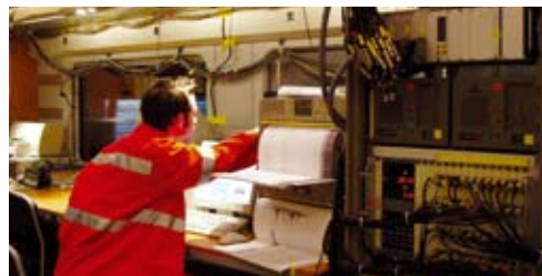
Un ingegnere della PROSE al lavoro nel compartimento misure appositamente allestito

PROSE ha partecipato all'intera procedura di omologazione, dall'inizio delle prove sui prototipi alla redazione finale del report sui test eseguiti. Ciò ha permesso di ridurre al minimo le interfacce con l'esterno, con una conseguente riduzione dei rischi e dei ritardi nel progetto.