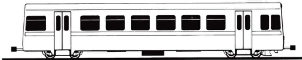
Typenskizze des Zahnradbahnsteuerwagens

Durch die Vergabe des Gesamtpakets für die Konstruktion der Steuerwagen war es ACMV möglich, das Gesamtprojekt innerhalb der terminlichen und kommerziellen Vorgaben zu realisieren.