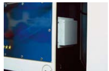
Schalldämpferprototyp im eingebauten Zustand