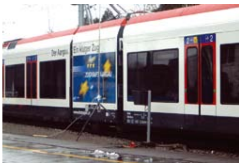
Messung des abgestrahlten Geräusches im Ursprungszustand als Grundlage für die Auslegung des Schalldämpfers

Auf Grund der strengen Lärmvorgaben für den Gelenktriebwagen für die Seetallinie in der Schweiz, musste die Schallabstrahlung des Kompressors reduziert werden. Es sollten mit möglichst geringem Aufwand im vorhandenen Bauraum geeignete schallreduzierende Massnahmen vorgeschlagen und umgesetzt werden.