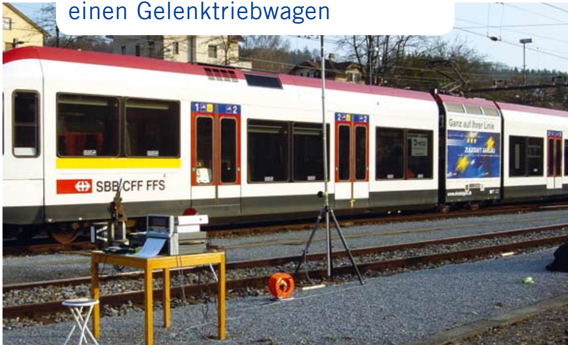
Durchführung der Lärmtypentestmessung nach erfolgreicher Erprobung des Schalldämpfers