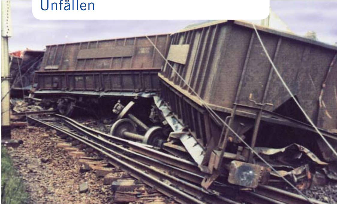
Unfall mit einem Erz-Transportzug nach Achsschenkelbruch