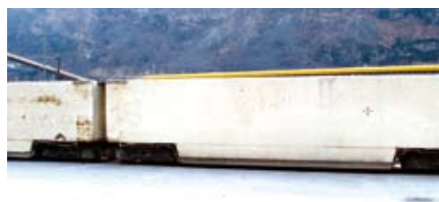
Betriebsunfall beim Schienentransport von Aushubmaterial in einem Tunnel

PROSE verfügt über Experten mit langjähriger Erfahrung im Eisenbahnwesen und dem notwendigen technischen Rüstzeug. PROSE Gutachten sind fachlich einwandfrei abgestützt und basieren auf dem umfangreichen Fachwissen der PROSE Experten und dem Stand der Technik. PROSE ist ein unabhängiges Ingenieurbüro und verfügt deshalb über die notwendige Neutralität in der Beurteilung von Betriebsstörungen und Unfällen.