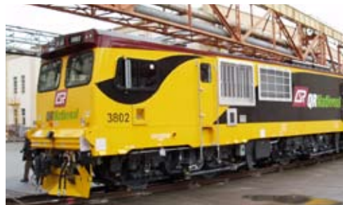
Sechsachsige Elektrolokomotive des Typs QR 3800 (Bauart Bo'Bo'Bo')

Um die vorgegebenen Termine einhalten zu können und aufgrund der geringen Stückzahl, wurde auf die Verwendung von Gussteilen verzichtet. Rahmen, Balancier und Längsmittnahme wurden als reine Schweisskonstruktionen ausgeführt.