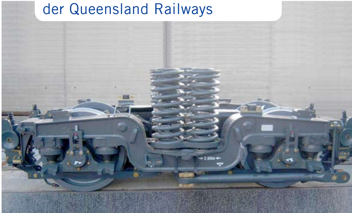
Motordrehgestell in Schmalspur (1067 mm) mit seitlich angebrachter Längsmittnahme für die sechsachsige Lokomotive des Typs QR 3800